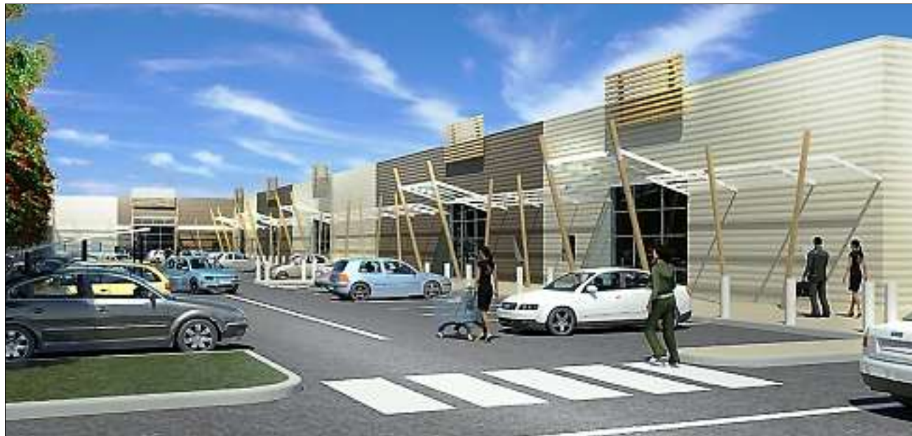
King Jouet, Litrimarché, KCVêtements et Boulangerie Marie ont déjà signé. Subway et MDA réfléchissent. Lidl ou Norma seraient aussi intéressés.