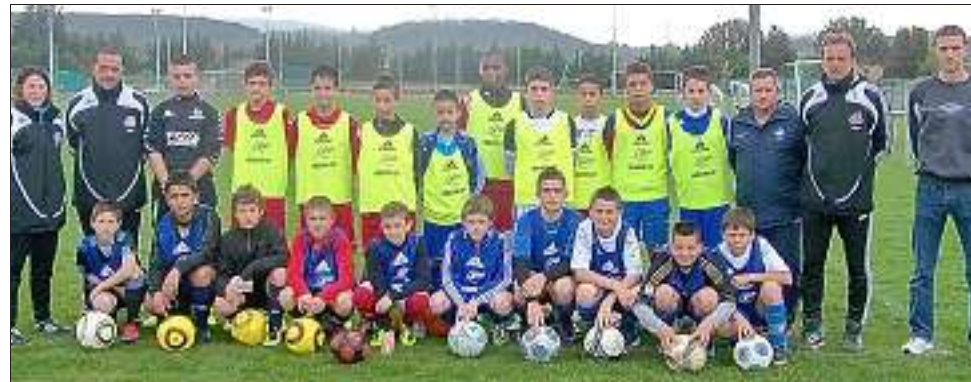
Les vingt derniers sélectionnés et leur encadrement au stade Michel Hidalgo. Christian KUSTER

Ils étaient 60 à tenter leur chance pour intégrer le Pôle Espoir d'Aix-en-Provence. A l'issue de deux premières séances qualificatives, il n'en restait plus que 20.