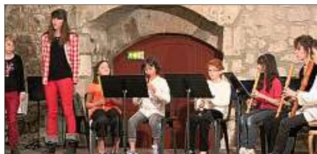
Les élèves du conservatoire ont joué à la salle Girard. Franck PREVOT

Le conservatoire à rayonnement intercommunal du Tricastin a offert mercredi à La Garde-Adhémar un concert de musique vocale baroque. Les classes de musique ancienne et de chant ont ainsi interprété plusieurs œuvres dont des extraits de Pergolesi, Haëndel, Purcell, Dowland et Caccini. Les parents et amis venus nombreux à ce concert ont pu apprécier la qualité des interprétations et les progrès réalisés par les uns et les autres.